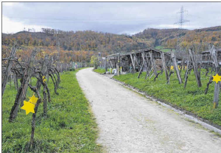
In Pratteln hängen die Sterne dieses Jahr besonders tief: Zwischen den Stationen weisen unzählige von ihnen den Weg.

sondern auch durch die Bürgergemeinde, Baselland Tourismus, dem Weinbauverein Pratteln und weiteren lokalen Gewerbetreibenden unterstützt. Und auch wenn es vom Publikumsaufmarsch kein zweites Esafgeben wird: Mit dem Märliweg setzt Pratteln wieder ein Zeichen weit über die Gemeindegrenzen hinaus. Engagement zahlt sich eben doch aus!