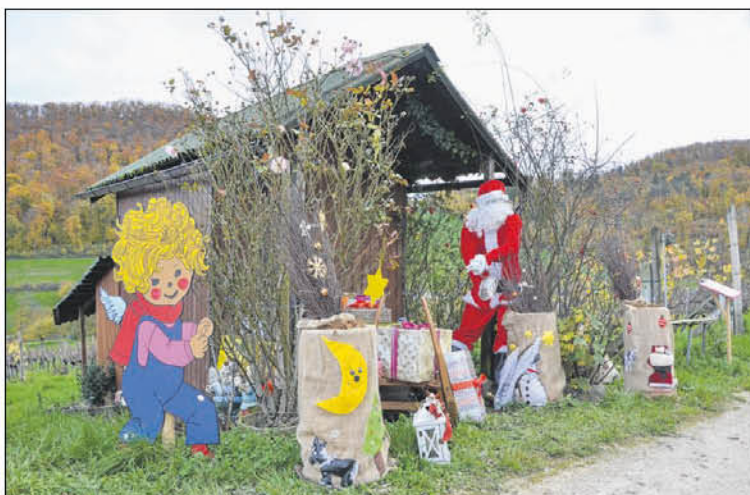
Die Märlistationen sind aufwändig dekoriert. Die passenden Geschichten dazu können via QR-Code abgehört werden.

Am Schluss waren es sodann rund 50 ehrenamtlich Helfer, die nicht nur die ganzen, zum Teil durch den langjährigen Gebrauch in Mitleidenschaft gezogene Dekorationen, wieder in Schuss brachten und ergänzten, sondern den Weg mit seinen insgesamt zwanzig Stationen – siebzehn davon mit einem Märchen – liebevoll dekorierten und die Stationen auch betreuen werden. Der Weg ist mit einer Länge von rund 2,9 Kilometern so angelegt, dass er auch problemlos von allen begangen werden kann, inklusive Kinderwagen. An einer kurzen Stelle,