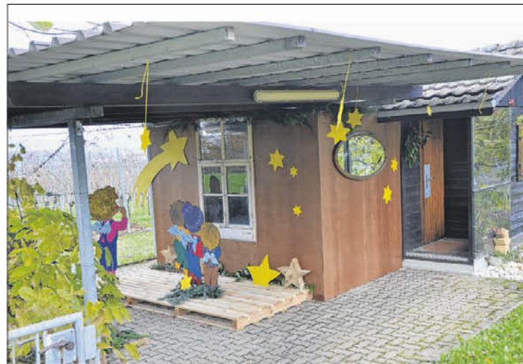
Was da wohl im Haus zu sehen ist? Die Stationen wurden teilweise sehr aufwändig und immer liebevoll gestaltet.